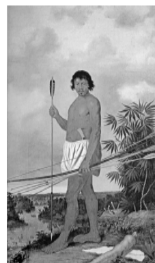
Albert Eckhout · Negro e Homem Tupinambá