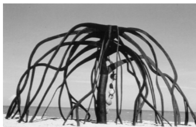
Franz Kracjberg · Flor do Mangue , 1973, Madeira, 320 x 900 cm, Nova Viçosa, Bahia

sa, fazendo um paralelo com os dias atuais. Fazer comparações com os outros rios. Investigar em que parte do rio pode haver mais poluição (nascente, foz, próximo às cidades, próximo às plantações). Pedir que os alunos incluam entrevistas com pesso-