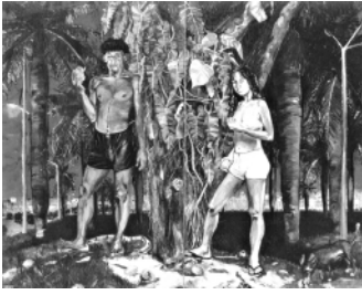
Roberto Ploeg · Adão e Eva e o Cão Chupando Manga , óleo sobre tela, 210 x 260 cm