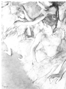
Edgar Degas · Canto do Palco durante o Balé , 1883, Coleção Particular, EUA