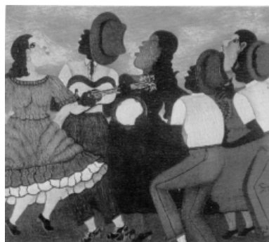
Heitor dos Prazeres · Roda de Samba , Rio de Janeiro

Visitar a Funai e pesquisar acervo e formas de atuação enquanto instituição que