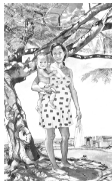
Roberto Ploeg · Recife , óleo sobre tela, 210 x 130 cm

· Gravar em vídeo, diretamente da TV, imagens da programação televisiva: jornalístico, novelas, programas de auditório, infantis, de variedade, de humor. Discutir sobre a amostragem re-